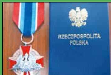
Wójt na medal