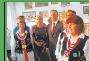
Jodłowianie u prezydenta