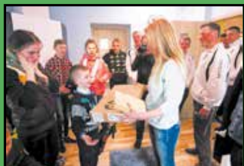
Anioły są w Jodłowej