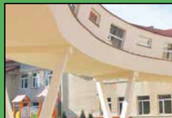
Przewiązka cieszy nie tylko